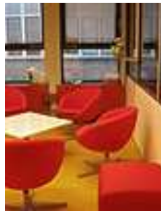
Impressie van het Ambulatorium

Op de afdeling orthopedagogiek worden ook hulpverleners opgeleid. Zij leren het vak door orthopedagogiek te studeren en door op het Ambulatorium ervaring op te doen onder supervisie van ervaren collega's.