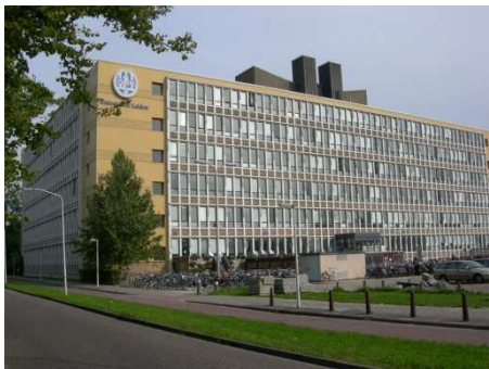
de faculteit sociale wetenschappen aan de Wassenaarseweg in Leiden

De afdeling orthopedagogiek heeft een Ambulatorium, een polikliniek waar ouders en kinderen terecht kunnen voor vragen die de opvoeding van hun kind betreffen en voor begeleiding. Voor de kinderen die naar het Ambulatorium komen geldt dat er voor hun ouders een extra uitdaging ligt bij het opvoeden van deze kinderen omdat deze kinderen in aanleg kwetsbaar zijn. Bij deze kinderen gaan veel dingen, die bij andere kinderen tijdens de opvoeding vanzelf lijken te gaan, juist niet vanzelf goed, waardoor extra zorg en aandacht voor deze kinderen nodig is. Bij het geven van deze extra zorg en aandacht, kunnen ouders worden bijgestaan door medewerkers van het Ambulatorium van de universiteit. Voor aanmelding en verwijzing www.ambulatorium-leiden.nl .